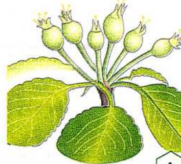
Chute des derniers pétales