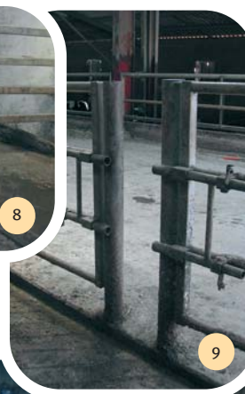
Un passage d'homme