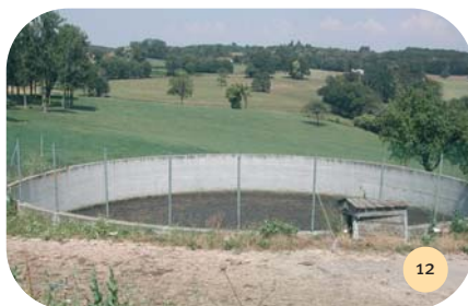
La fosse à lisier centrale pour l'ensemble de l'exploitation.