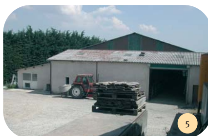
Vue du pignon Nord-Ouest.