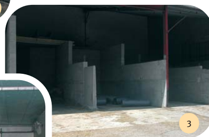
Le stockage des céréales.