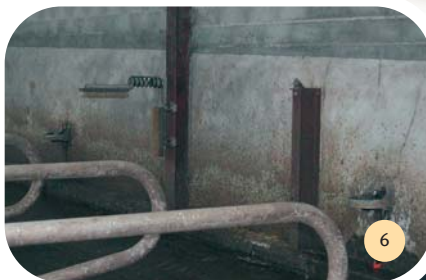
Les abreuvoirs et les brosses.