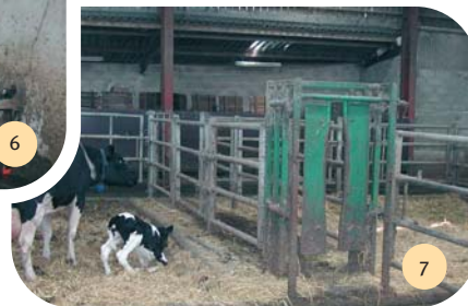
Les box d'isolement et le système de contention.