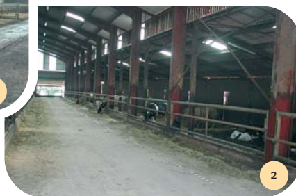
Le couloir de distribution central.