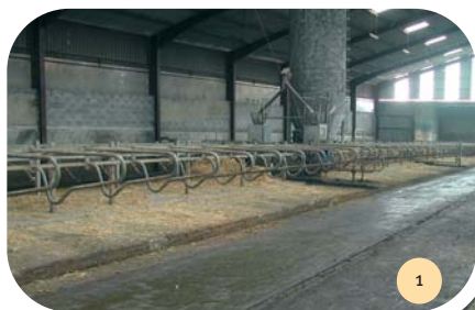
Vue d'ensemble du bâtiment.