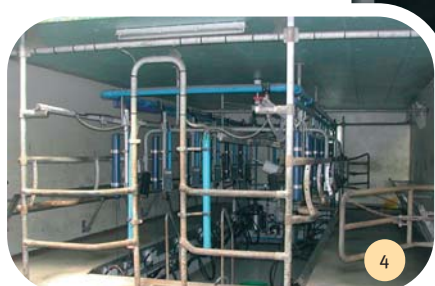
Vue de la salle de traite.