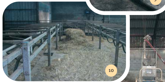
Le couloir de paillage.