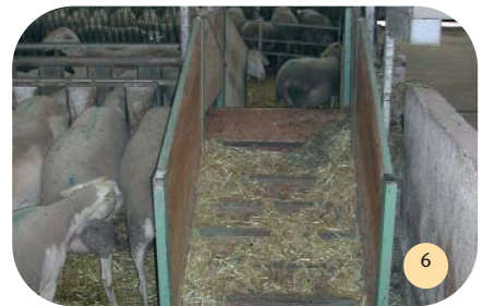
Organisation des circuits vers la salle de traite.