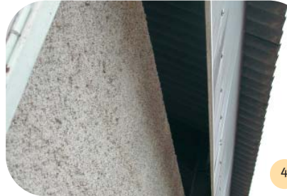
Vue du dessous du bardage décalé.