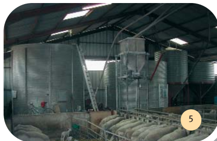
Liaison directe entre la cellule et la mélangeuse.