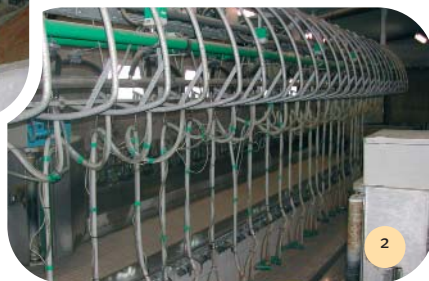
Salle de traite.