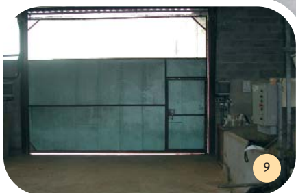
Porte sur portail.