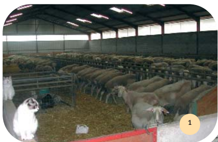
Vue de l'aire de vie des brebis.