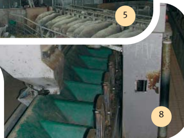
Distribution automatisée en salle de traite de 3 aliments et paraffine.