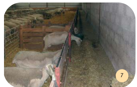
Couloirs de service bétonnés autour des paddocks.