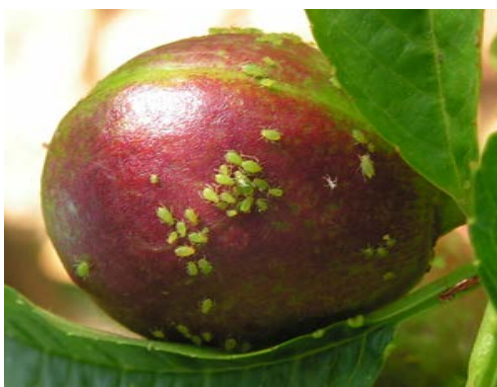
PUCERON / FUMAGINE