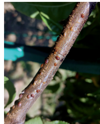
PUCERON GÉANT BRUN DU PÊCHER