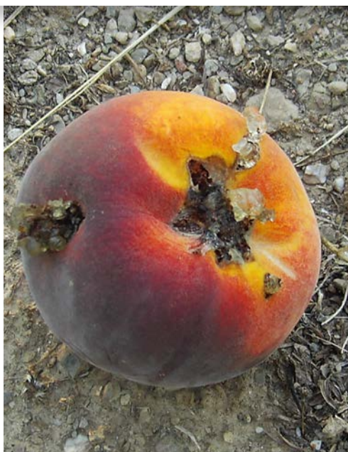
TORDEUSE ORIENTALE / PETITE MINEUSE ANARSIA