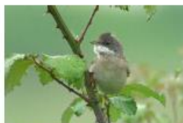
Fauvette grisette

Productive, la ronce permet aussi de faire tartes, confitures, gelées et sirops, histoire de confirmer que la préservation de la nature, c'est aussi bon pour l'estomac.