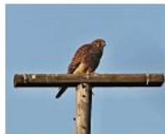
Faucon crécerelle © Krestel

Les rapaces diurnes et nocturnes ont pour habitude de se percher régulièrement au cours de leurs sessions de chasse. Cela leur permet d'économiser leur énergie, surtout en hiver, et de chasser à l'affût. Les rapaces de campagne (buse variable, faucon crécerelle, effraie des clochers...) sont de gros consommateurs de petits mammifères, surtout de campagnols, musaraignes et mulots. En posant des perchoirs, vous favoriserez la présence de ces auxiliaires des cultures.