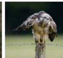
Buse variable