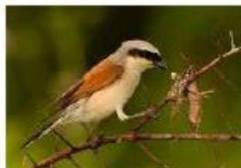
Pie-Grièche écorcheur