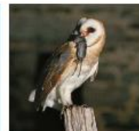
Effraie des clochers