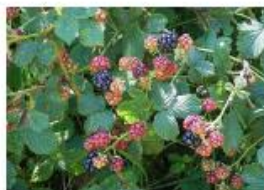
Ronce commune

Conserver ou laisser s'installer quelques ronciers dans un recoin non utilisé de l'exploitation peut radicalement en modifier l'attractivité pour la faune, notamment dans les zones les plus ouvertes. Cette plante joue en effet un rôle capital, notamment pour les oiseaux, à qui elle offre ses baies, pour que les graines soient disséminées, et dont les épines, orientées vers le bas, repoussent les prédateurs terrestres. Il en existe plus de 100 espèces en France !