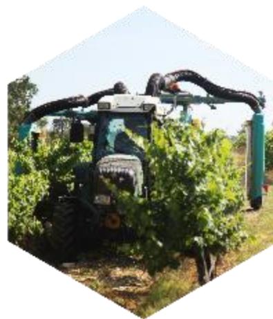
Le réchauffement climatique