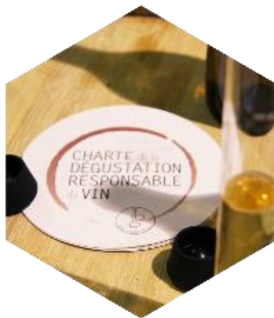
La santé publique